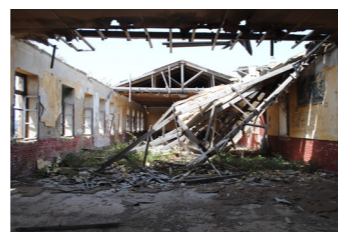
Άποψεις από το εσωτερικό