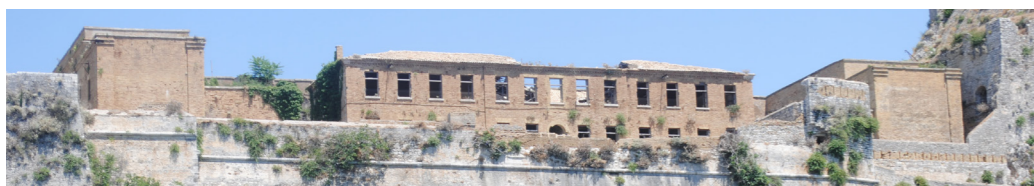
Άποψη από τα νότια