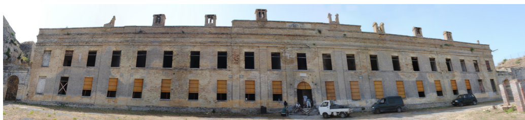
Άποψη από τα βόρεια