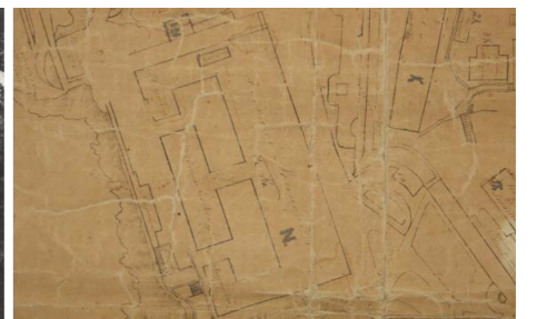
Σχέδιο του νοσοκομείου. Λεπτομέρεια από τον χάρτη του Παλαιού φρουρίου περιόδου Βρετανικής προστασίας.