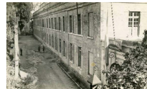
Η βόρεια όψη την περίοδο του Μεσοπόλεμου Άποψη των στεγών