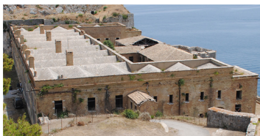
Άποψη του συγκροτήματος από τον Πύργο της Θάλασσας