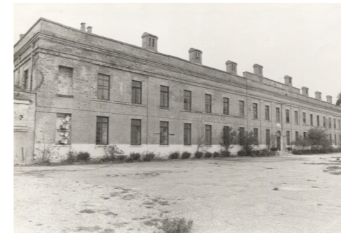
Άποψη της πρόσοψης, πιθανόν κατά τη δεκαετία 1980 (Πηγή: Αρχείο ΔΑΒΜΜ).