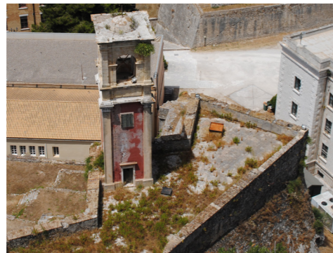
Γενική άποψη του κωδωνοστασίου από ψηλά