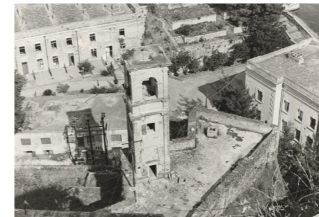
Γενική άποψη από ψηλά προ του 1983