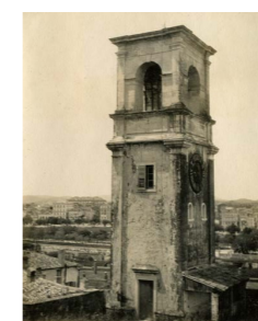
Το κωδωνοστάσιο το μεσοπόλεμο (Πηγή: Στανέλλος Λ., 2015 Πηγή πρωτότυπου: Αρχείο J. Manessi)