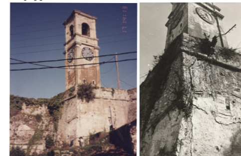
Βόρειανατολική όψη, Άποψη από τα 1993, (Πηγή: Αρχείο νοτιοδυτικά (Πηγή: ΔΑΒΜΜ) Αρχείο ΔΑΒΜΜ)