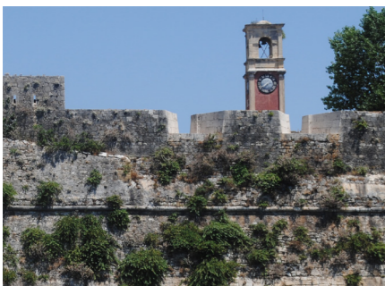
Απόψεις από το θαλάσσιο μέτωπο στα νότια