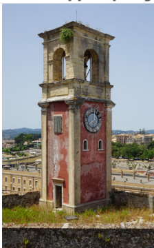
Απόψεις του κωδωνοστασίου