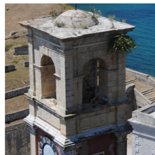
Λεπτομέρεια της ανωδομής