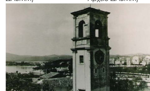
Κωδωνοστάσιο, αρχές 20ου αιώνα