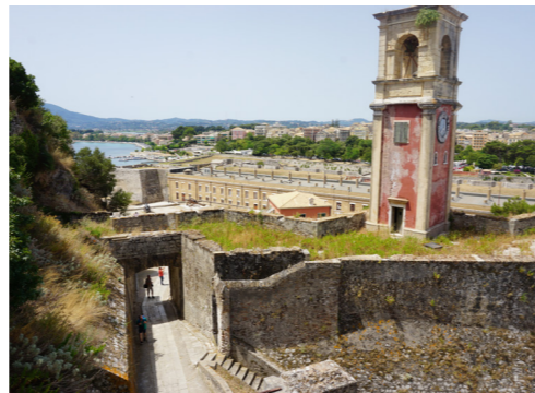
Άποψη του κωδωνοστασίου και του πριονοειδούς οχυρού πάνω στο οποίο έχει θεμελιωθεί από τα νότια.