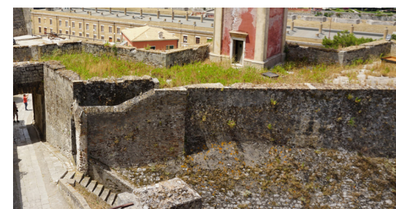
Άποψη ανατολική πλευράς οχυρώματος