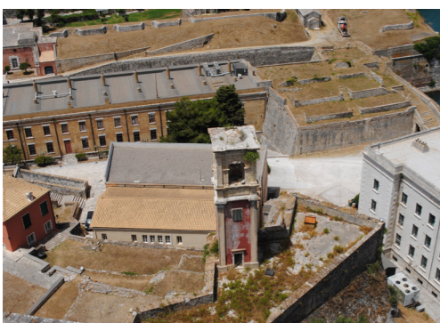
Άποψη του οχυρώματος από ψηλά.