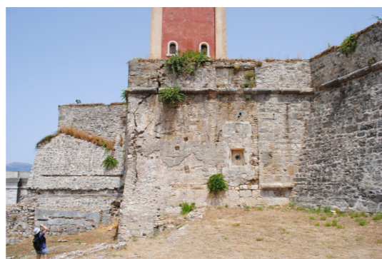
Απόψεις από τα δυτικά.