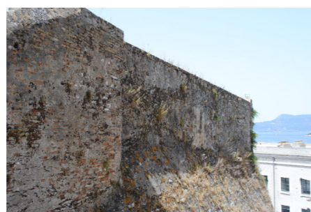
Άποψη ανατολική πλευράς οχυρώματος. Διακρίνεται τμήμα από οπτοπλινθοδομή.