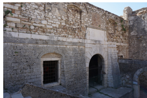
Η πρόσοψη του κτιρίου.