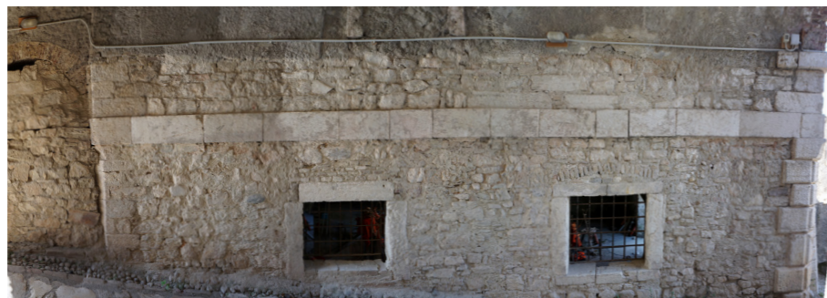
Η όψη προς τη στοά.