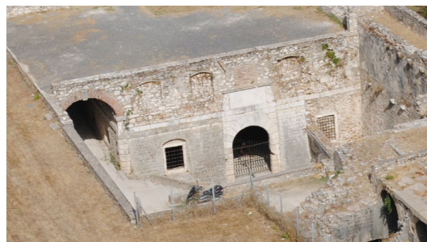
Άποψη του κτιρίου από ψηλά, όπως σώζεται σήμερα μετά την κατεδάφιση του στρατώνα.