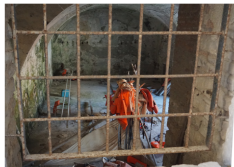
Άποψη του εσωτερικού χώρου