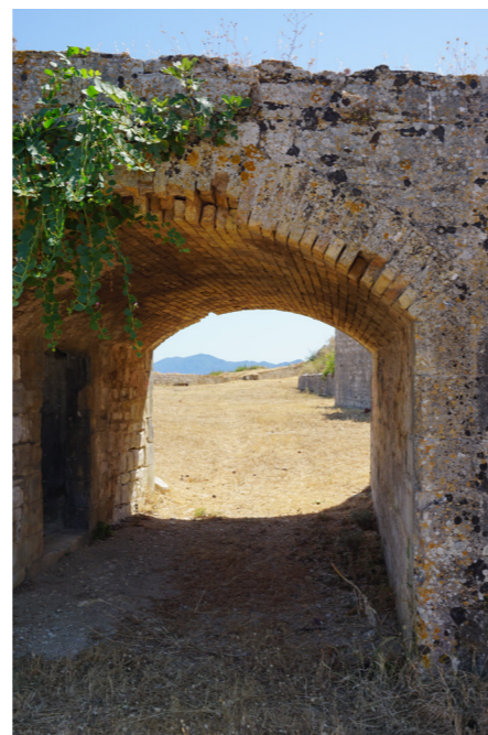
Η στοά της πυριτιδαποθήκης