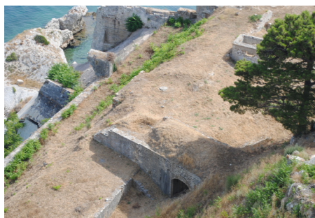
Αποψη από ψηλά