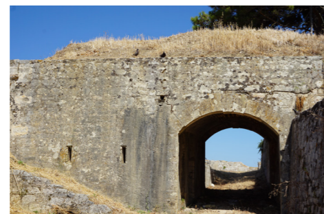
Ανατολική όψη στοάς