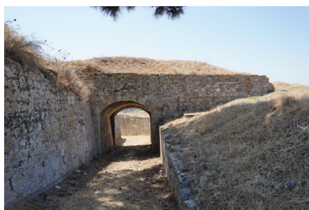
Δυτική όψη διαβατικού