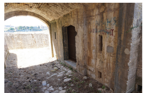
Εσωτερική άποψη στοάς, είσοδος πυριτιδαποθήκης