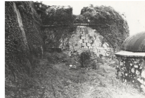
Φωτογραφία αρχείου, 1982