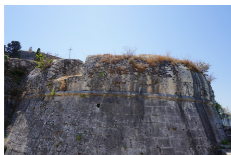
Παραπέτο του Πύργου