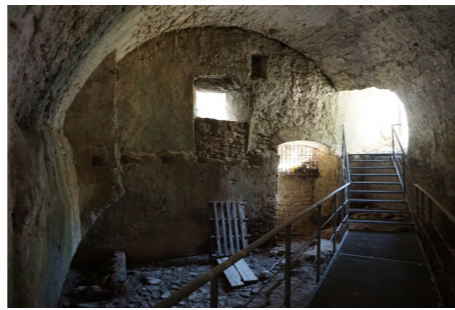
Εσωτερικός χώρος Πύργου