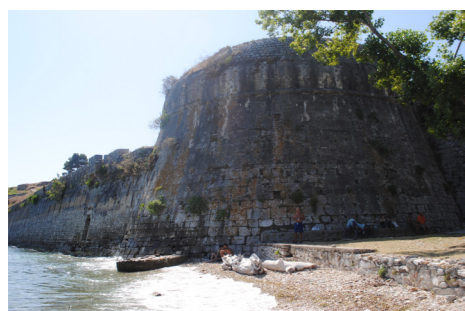
Βορειοδυτική άποψη του Πύργου