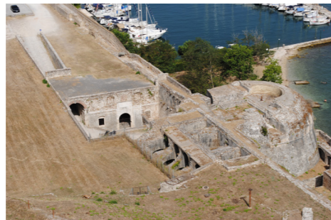
Άποψη του Πύργου από ψηλά