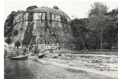
Φωτογραφία αρχείου, 1982