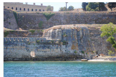
Άποψη του Πύργου από τη θάλασσα