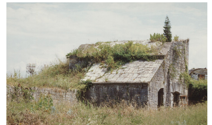
Φωτογραφία αρχείου, 1992