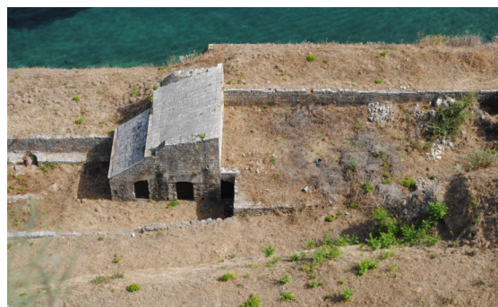
Γενική άποψη της ορθογωνικής πυριτιδαποθήκης