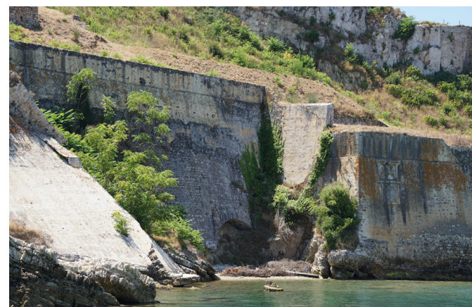
Η ανατολική γωνία του τείχους.