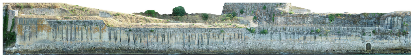
Το βόρειο τμήμα των θαλάσσιων τειχών στην περιοχή Καβοσίδερο.