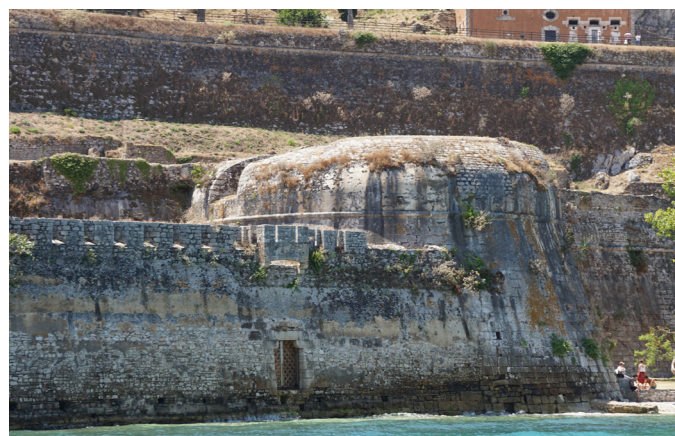
Η θαλάσσια πύλη και τα τείχη.