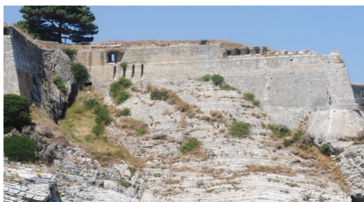
Εξωτερική όψη θαλάσσιων τειχών στη θέση της αίθουσας