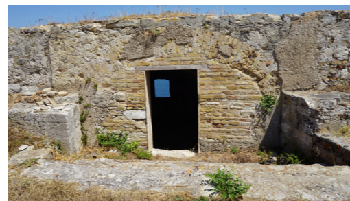
Άποψη εισόδου θολωτού υπόγειου χώρου