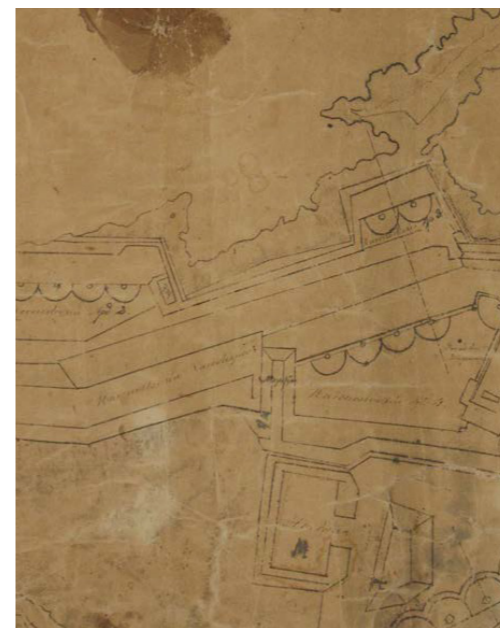
Απόσπασμα χάρτη Βρετανικής Περιόδου με ελληνικό υπόμνημα