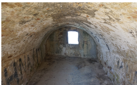
Άποψη εσωτερικού χώρου