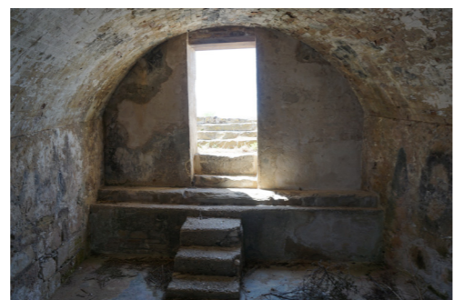
Η είσοδος από το εσωτερικό