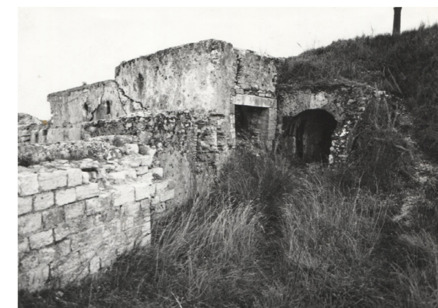
Φωτογραφία αρχείου, 1983