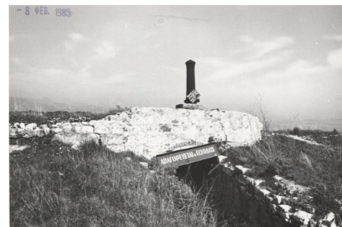
Φωτογραφία αρχείου, 1983