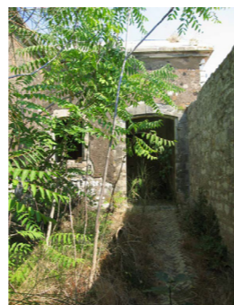
Είσοδος από νότια πλευρά (Πηγή: Στανέλλος Λ., 2015, σελ.323)