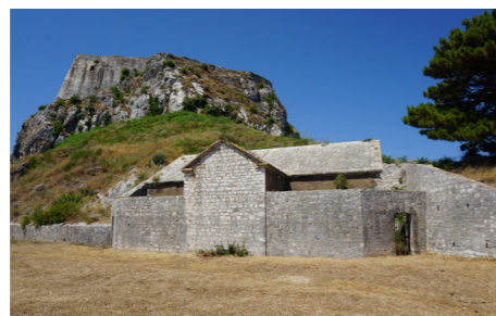
Δυτική όψη πυριτιδαποθήκης