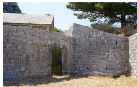
Βόρεια είσοδος στον περίβολο