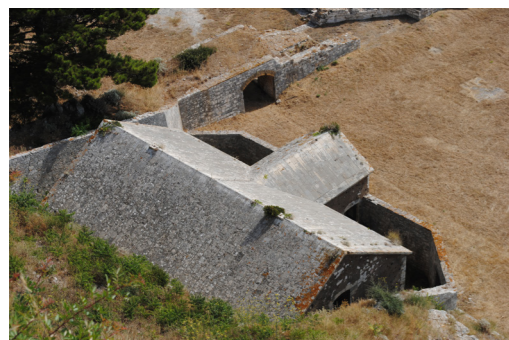
Άποψη από ψηλά