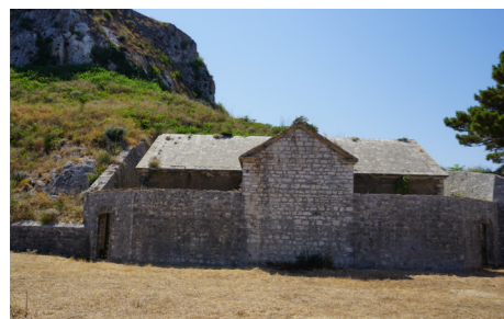
Δυτική όψη πυριτιδαποθήκης