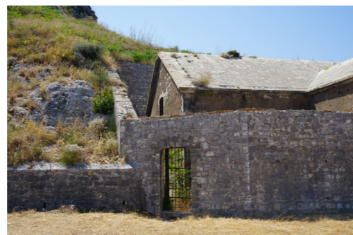
Νότια είσοδος στον περίβολο