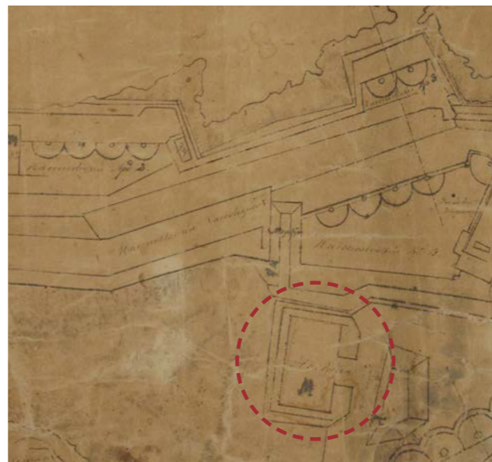
Απόσπασμα χάρτη Βρετανικής Περιόδου με ελληνικό υπόμνημα