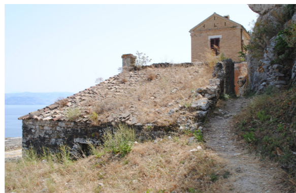
Άποψη από τα δυτικά.