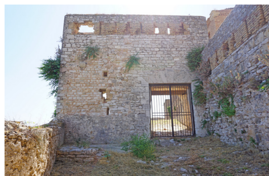
Εξωτερική όψη (από τα ανατολικά).