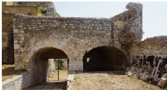
Όψη από το Αγγλικό νοσοκομείο (από τα δυτικά).