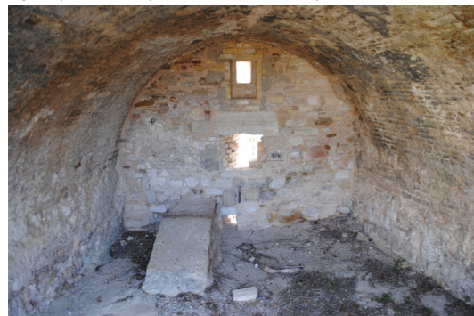
Θολοσκεπής χώρος εφαιπτόμενος στα νότια της εισόδου.