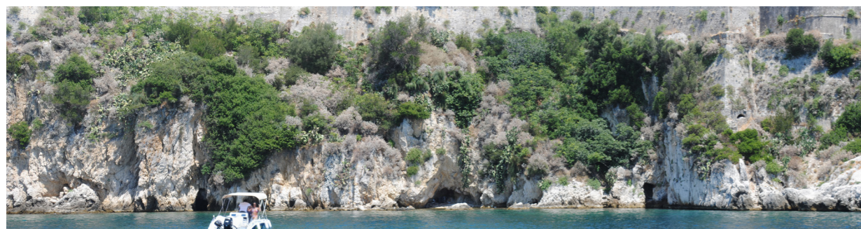
Όψη του βραχώδους πρηνούς πάνω στο οποίο θεμελιώνεται το τείχος.