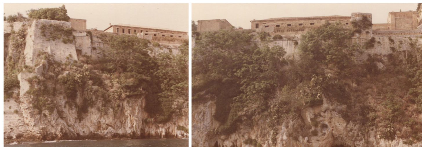
Απόψεις του θαλάσσιου μετώπου των τειχών, πιθανόν τη δεκαετία του 1990.