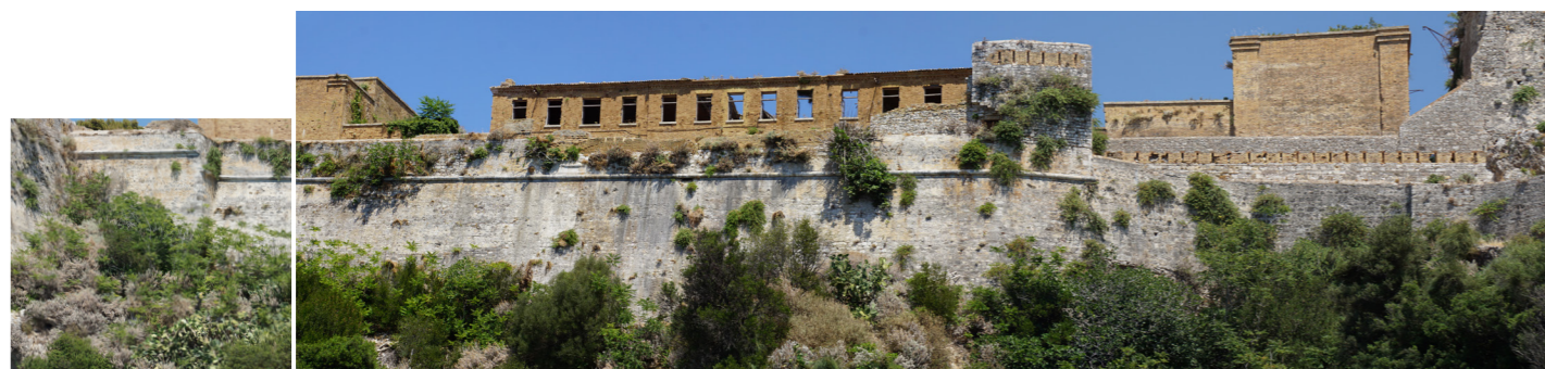
Το τμήμα του θαλάσσιου τείχους στο Αγγλικό Νοσοκομείο.