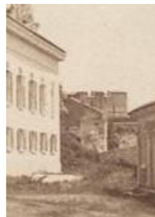
Λεπτομέρεια από φωτογραφία των αρχών του 20ου αιώνα.