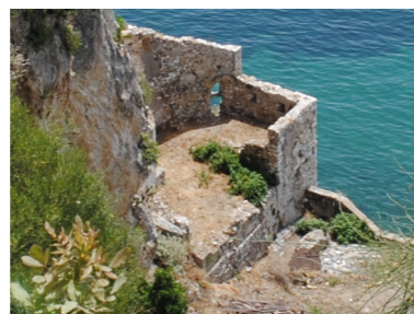
Άποψη από τον πύργο της Ξηράς.