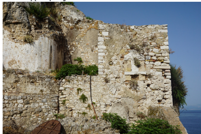
Η δυτική όψη του κτιρίου.