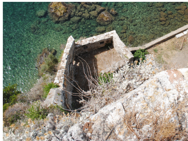
Άποψη του κτιρίου από το Αγγλικό Νοσοκομείο.