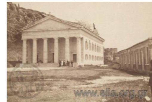
Ο ναός και η αποθήκη υλικού Βερσιάδας στις αρχές του 20ου αι., πριν την κατεδάφισή της