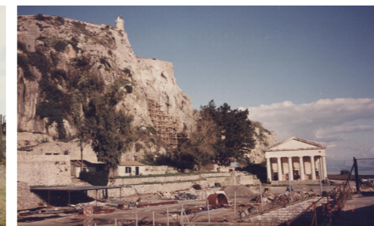
Άποψη του πλατώματος της Βερσιάδας το 1993, κατά τις εργασίες υπαιθριων διαμορφώσεων. Στο βάθος διακρίνεται ο ναός του Αγ. Γεωργίου.