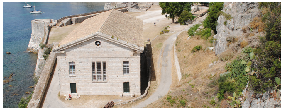
Εξωτερικές απόψεις του ναού από τη Βερσιάδα (πάνω αριστερά), από τη θάλασσα (πάνω δεξιά) και από το Αγγλικό Νοσοκομείο (κάτω).