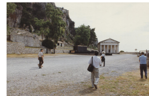
Άποψη του πλατώματος της Βερσιάδας το 1992. Στο βάθος διακρίνεται ο ναός του Αγ. Γεωργίου.