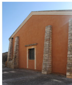
ΒΑ όψη, 2021