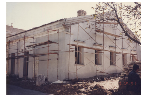
Εργασίες αποκ/σης 1993