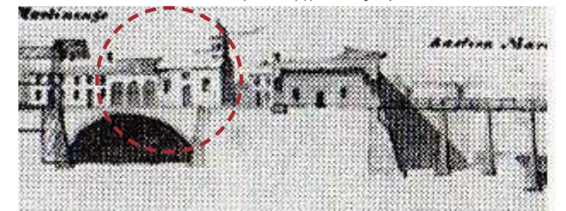
Τομή αποτύπωσης, 1824