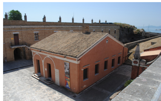
Άποψη από ψηλά.