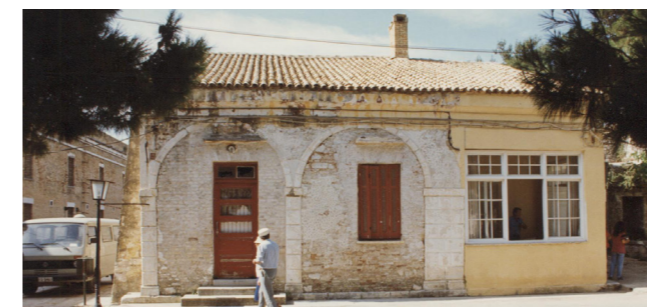
Το παρεκκλήσι πριν την αποκατάσταση