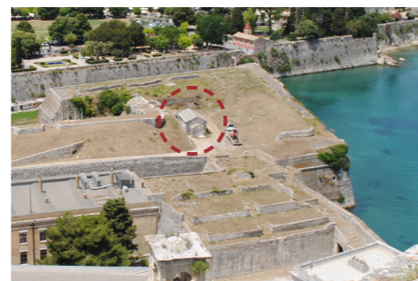
Απόψη από ψηλά.