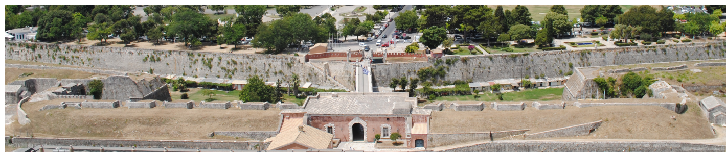
Άποψη από ψηλά.