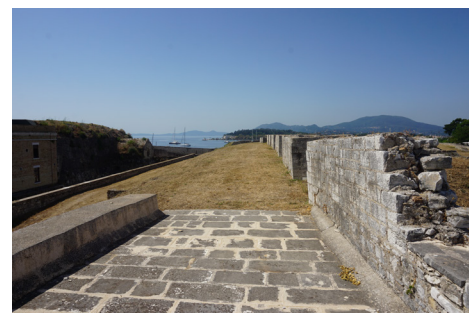
Τμήμα της Κορτίνα από τον προμαχώνα Martinengo προς το Savorgnan.