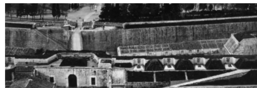
Φωτογραφία 1862, (Πηγή: Στανέλλος Λ., 2015, Πηγή Πρωτοτύπου: Francis Bedford, Αρχείο Θ. Τζίκα)