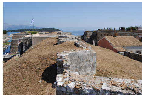
Τμήμα της Κορτίνα από τον προμαχώνα Savorgnan προς τον Martinengo.