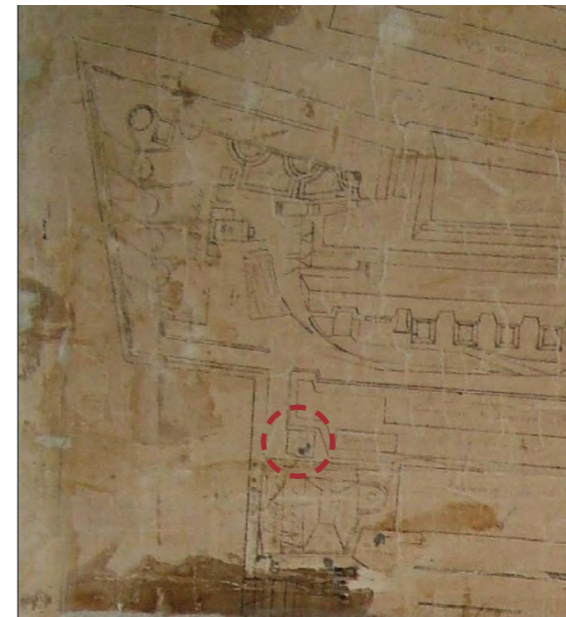
Απόσπασμα χάρτη Βρετανικής Περιόδου με ελληνικό υπόμνημα