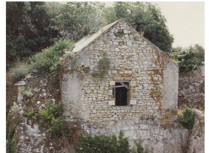
Φωτογραφία αρχείου 1992