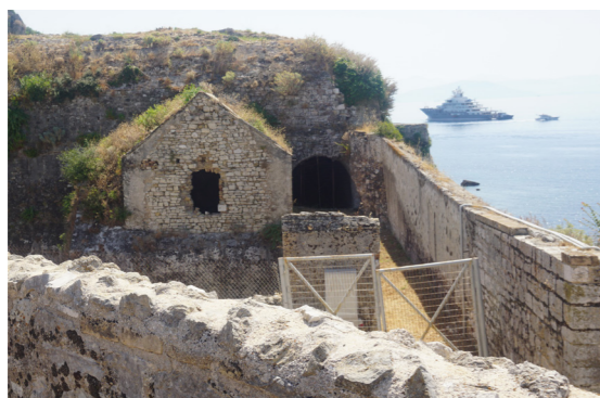
Αποψη του κτιρίου από τον προμαχώνα.