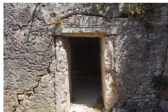
Είσοδος από νότια.