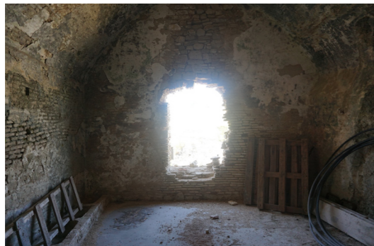
Αποψη από το εσωτερικό του κτιρίου.