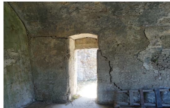
Η είσοδος από το εσωτερικό.