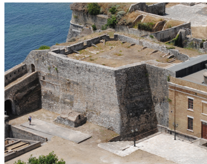
Άποψη επιπρομαχώνα από το εσωτερικό του φρουρίου.

Αργολιθοδομή με ημιλαξευτούς γωνιόλιθους και διαπλάτυνση στη βάση του επιπρομαχώνα.