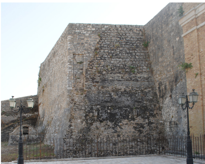
Βόρεια όψη επιπρομαχώνα.