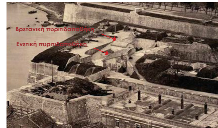
Άποψη του προμαχώνα και της πυριτιδαποθήκης από ψηλά, 1862.