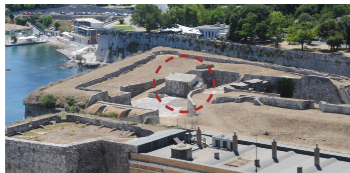
Άποψη του προμαχώνα και της πυριτιδαποθήκης από ψηλά.