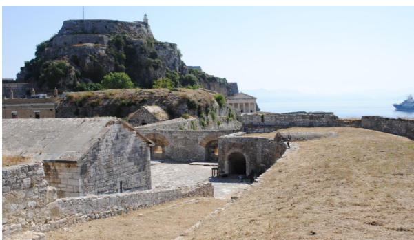
Άποψη από ΝΔ.