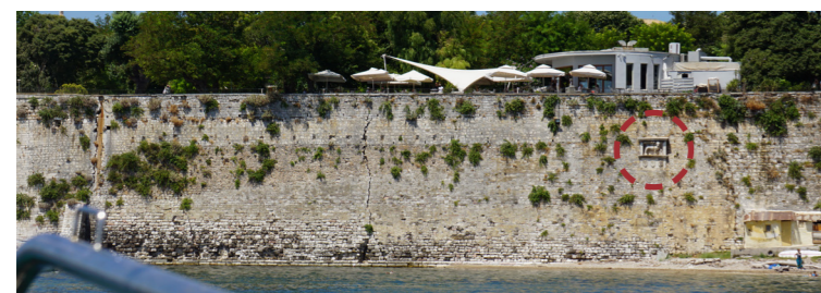
Άποψη του νοτίου τμήματος του αντικρημνού.