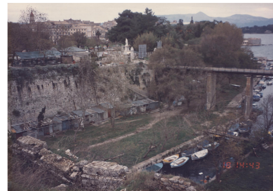
Άποψη του νοτίου τμήματος του αντικρημνού το 1993. Διακρίνεται αυξημένη δεντροφύτευση στο βόρειο τμήμα.