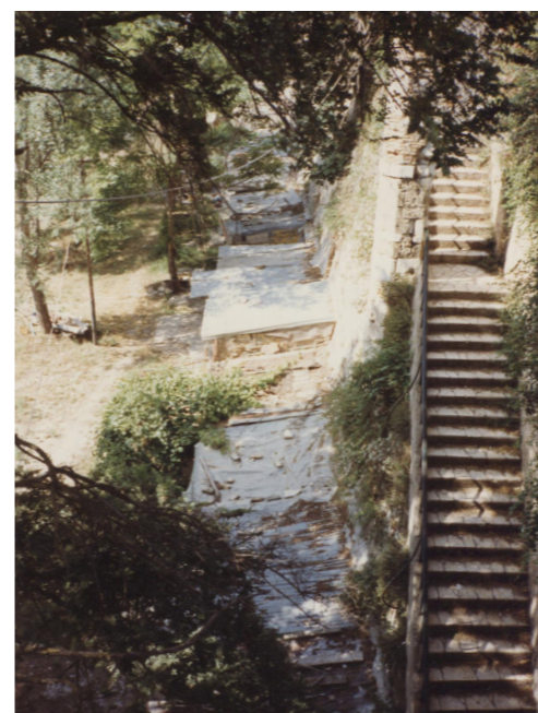
Πλάγια άποψη του νοτίου τμήματος του αντικρημνού, πιθανόν το 1992.