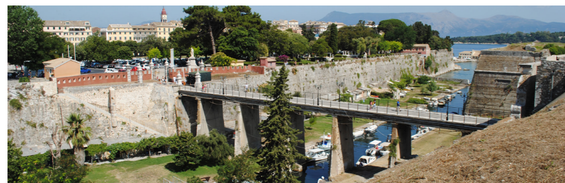
Άποψη του αντικρημνού από τα ανατολικά.