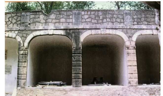
Φωτογραφίες αρχείου 1993