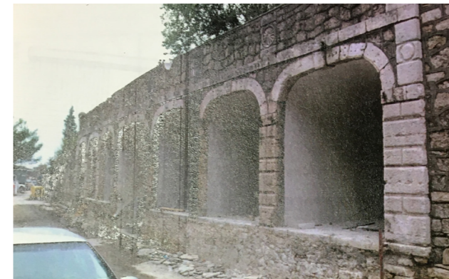
Φωτογραφίες αρχείου 1993