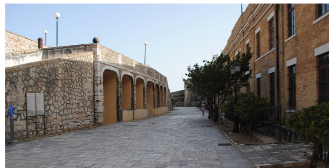
Στοές σε σειρά.