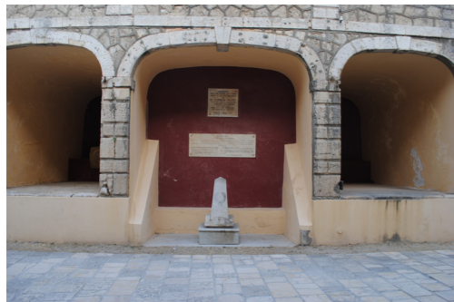
Στοές δυτικής όψης.