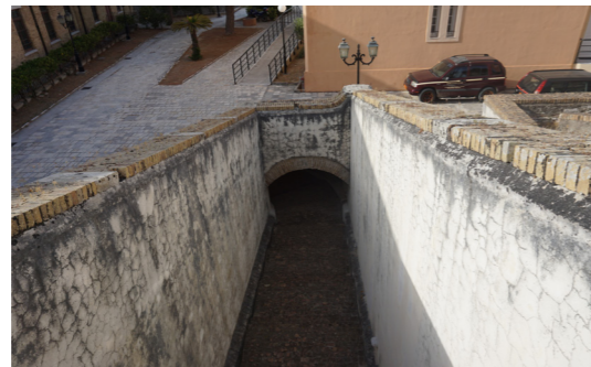
Άποψη από ψηλά.