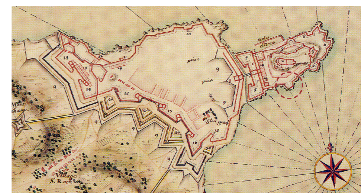
Απεικόνιση του πύργου σε κάτοψη σε χάρτη του 1716