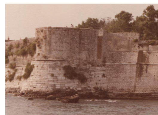
Άποψη του πύργου, πιθανόν τη δεκαετία 1990.