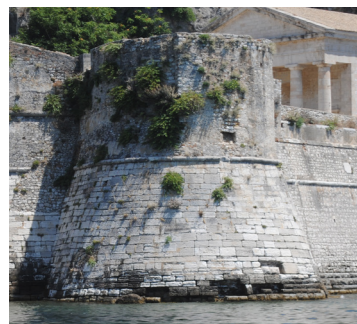
Απόψεις του πύργου από τη θάλασσα.