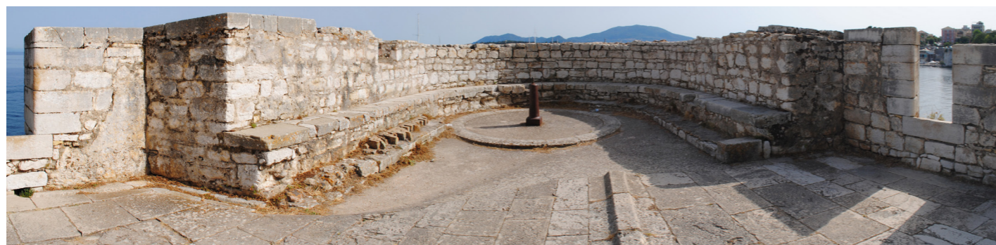
Άποψη του πύργου στο επίπεδο της μάχης.