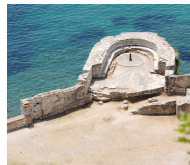
Άποψη του επιπέδου της μάχης από ψηλά.