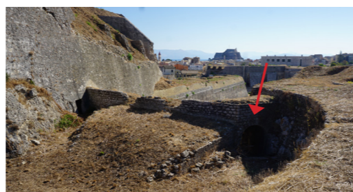
Πύλη στα ΝΑ του ημιπρομαχώνα.