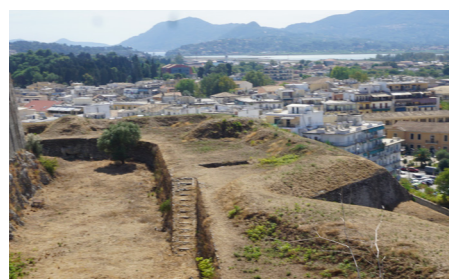
Κλίμακα ανόδου στο ανώτερο επίπεδο του ημιπρομαχώνα.