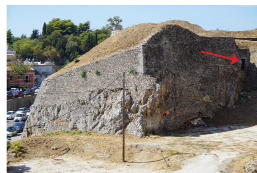
Νοτιοανατολική όψη, θεμελίωση σε βράχο.