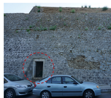
Πυλίδα στην οδό Βλαίκου