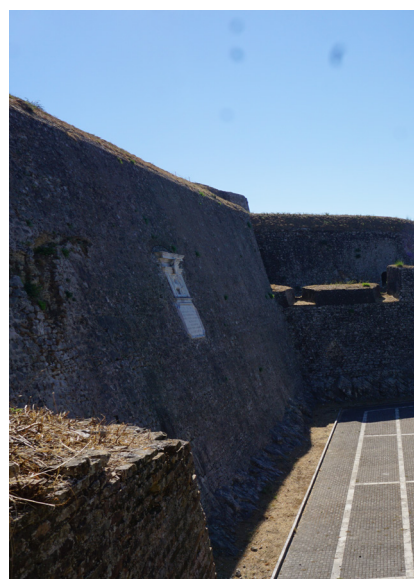
Εξωτερική όψη της κορτίνα και διαμόρφωση στο επίπεδο της οδού Βλαίκου.