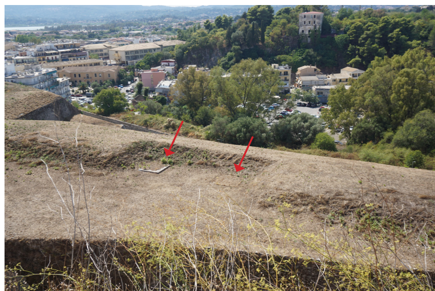
Το άνω επίπεδο της κορτίνα με το χωμάτινο παραπέτο, στο οποίο διακρίνονται οι οι θέσεις μάχης των Βρετανών.