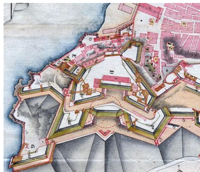
Η θέση της κορτίνα στο χάρτη Ganassa, τέλη του 18 ου αι.