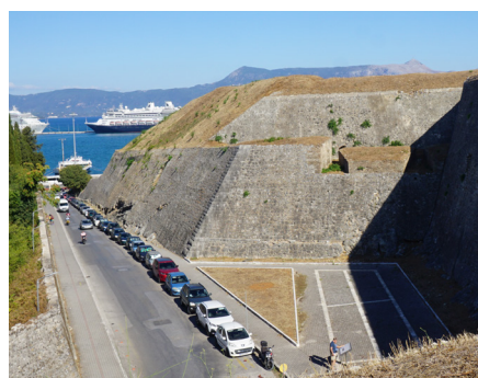
Νότια όψη, οδός Βλαίκου.