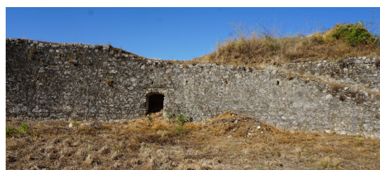
Ράμπα σύνδεσης της κύριας τάφρου με το άνω επίπεδο του ημιπρομαχώνα.