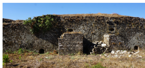
Είσοδοι των θολωτών αιθουσών πίσω από την πρόσθετη τοιχοποιία και αγωγοί απορροής εκατέρωθεν.