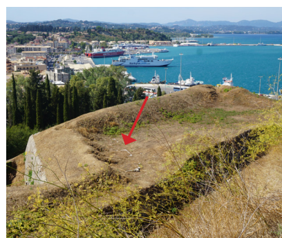
Άνω επίπεδο ημιπρομαχώνα, διακρίνονται οι λίθινες βάσεις των κανονιών.