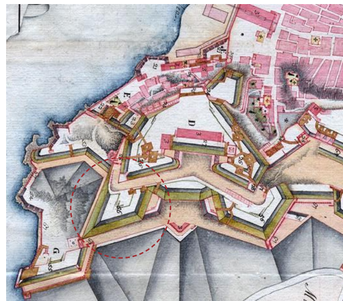
Η θέση του ημιπρομαχώνα στο χάρτη Ganassa, τέλη του 18 ου αι.