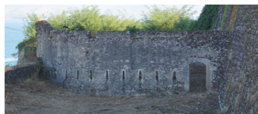
Είσοδος στο χώρο της πύλης από την τάφρο.