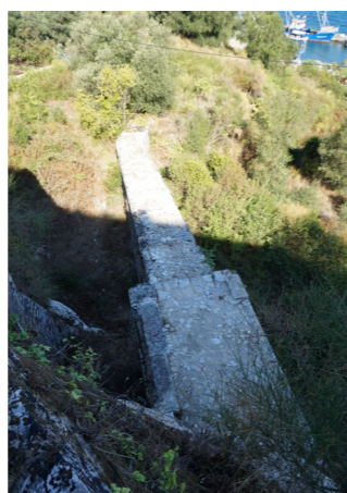
Λίθινη ράμπα ανόδου.