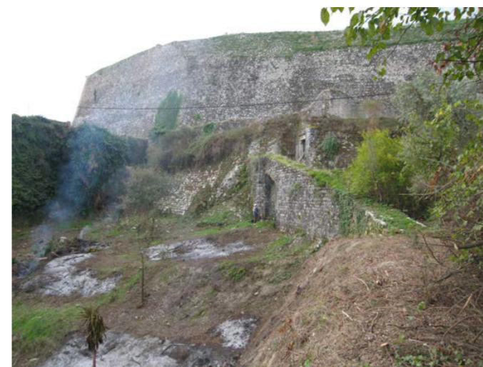
Η ράμπα ανόδου από την περιοχή της Κορακοφωλιάς