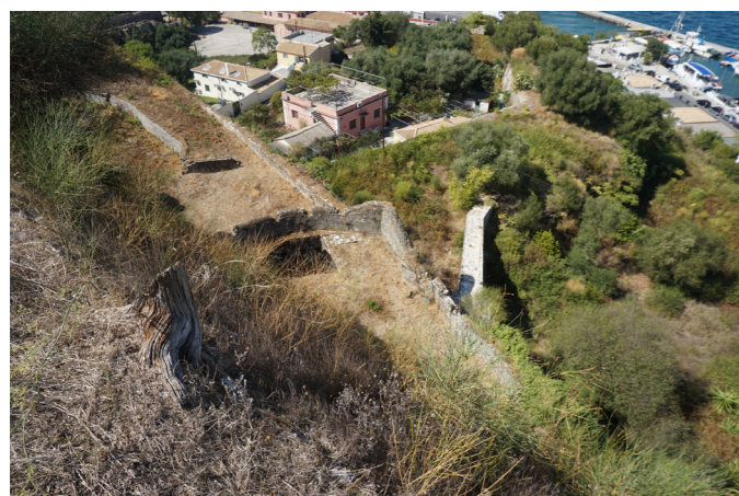
Ο χώρος της πύλης από ψηλά.