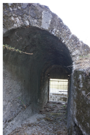
Θολωτός διάδρομος πύλης.