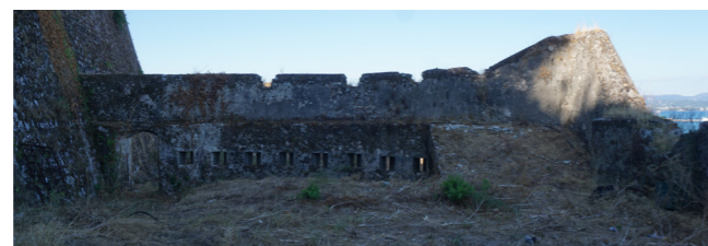
Τυφεκιοθυρίδες σε σειρά στην τοιχοποιία της πύλης.