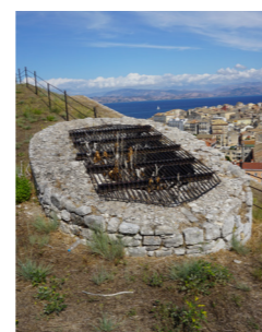
Απόληξη αγωγού για τον αερισμό των υπόγειων.