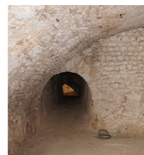
Χώρος στο υπόγειο.