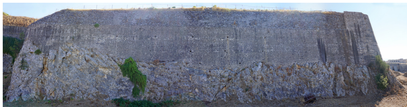
Το δυτικό μέτωπο του προμαχώνα.