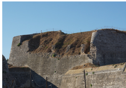
Άποψη από τα νότια.