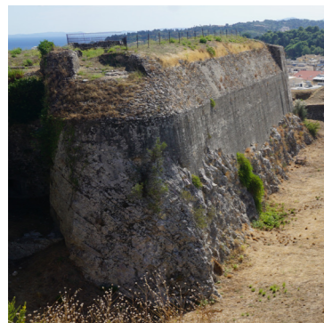
Άποψη από τα βόρεια.