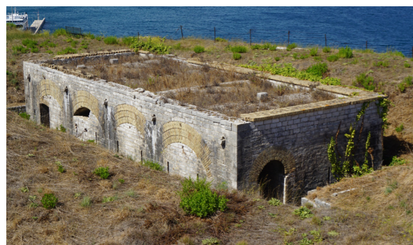
Άποψη από τα νότια.