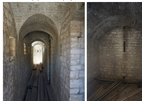
Ο ευθύγραμμος διάδρομος εισόδου.