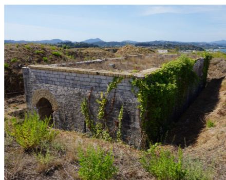
Άποψη από τα βόρεια.