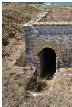
Η κτιστή κλίμακα καθόδου και η ανατολική είσοδος στην πυριτιδαποθήκη.