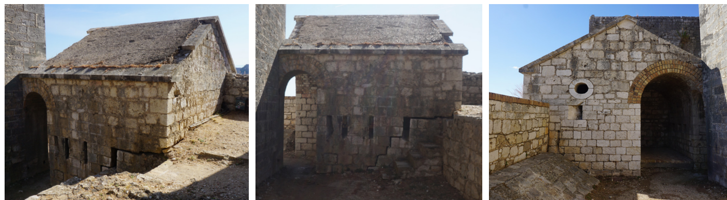
Απόψεις της νότιας καπονιέρας από τα νοτιοδυτικά.