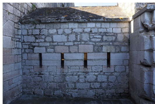
Όψη από την Πύλη εισόδου στο υψηλό επίπεδο με τις τυφεκιοθυρίδες.