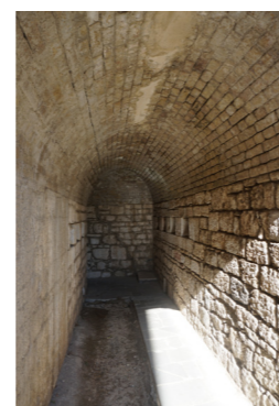
Όψη από την Πύλη εισόδου στο υψηλό επίπεδο.