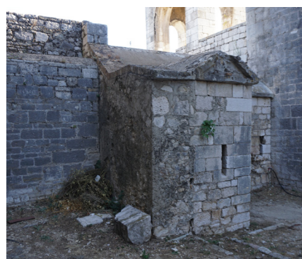
Απόψεις από το υψηλό επίπεδο. Διακρίνονται οι τυφεκιοθυρίδες.