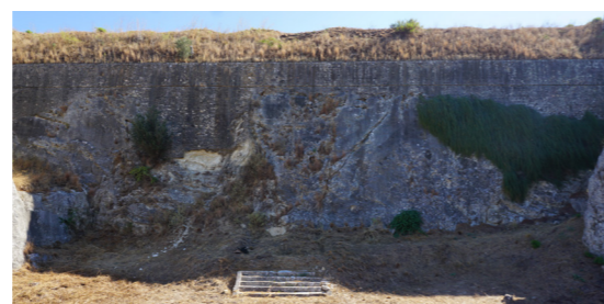
Άποψη του δυτικού μετώπου από το επίπεδο του σκάρπωνα.