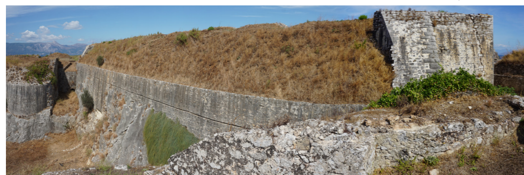
Άποψη από τα νότια.