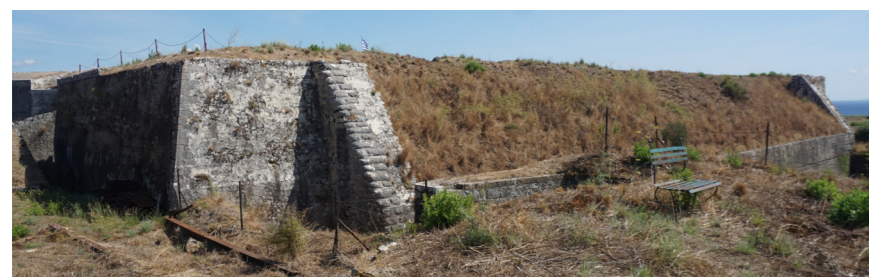
Άποψη από τα βόρεια.