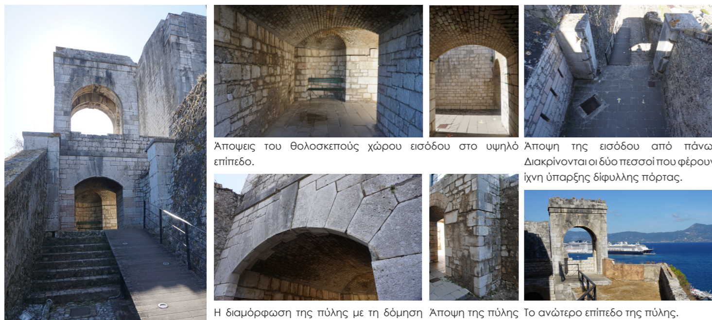
Άποψεις του θολοσκεπούς χώρου εισόδου στο υψηλό επίπεδο. Άποψη της εισόδου από πάνω. Διακρίνονται οι δύο πεσσοί που φέρουν ίχνη ύπαρξης δίφυλλης πόρτας. Η διαμόρφωση της πύλης με τη δόμηση του τόξου από λαξευτούς λίθους. Άποψη της πύλης από το υψηλό επίπεδο. Το ανώτερο επίπεδο της πύλης.