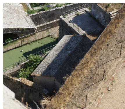
Πυριτιδαποθήκη χαμηλού επιπέδου από ψηλά.