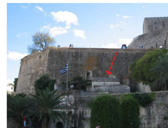
Βόρεια όψη πυριτιδαποθήκης.