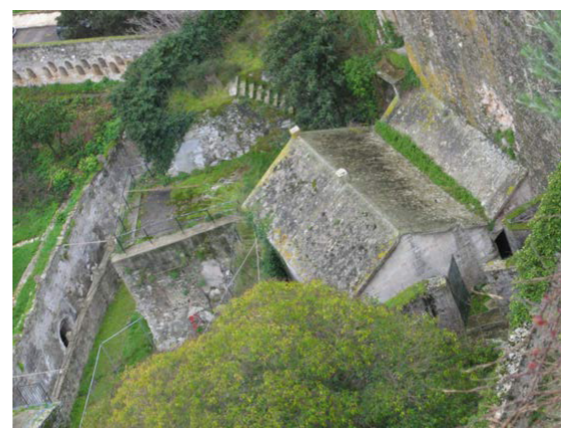
Άποψη της πυριτιδαποθήκης από ψηλά