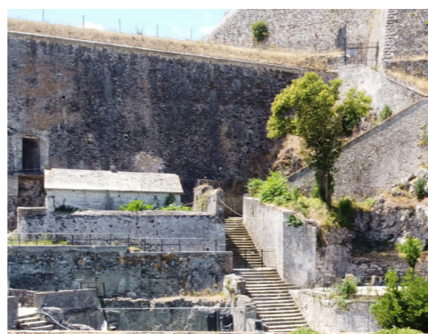
Ανατολική όψη της πυριτιδαποθήκης και η σχέση της με την κλίμακα ανόδου στον ημιπρομαχώνα.