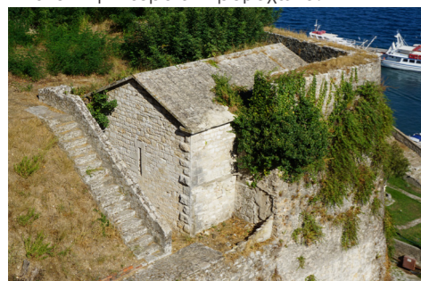
ΝΑ όψη πυριτιδαποθήκης.