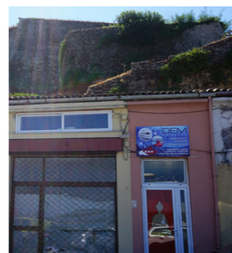
Βόρεια όψη επιπρομαχώνα.