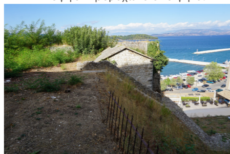
Νότια όψη πυριτιδαποθήκης.