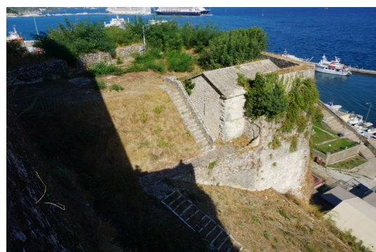
Ανατολική πλευρά επιπρομαχώνα.