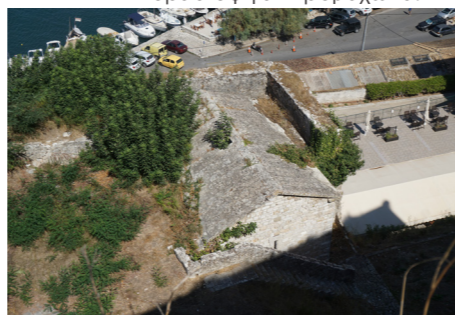
Άποψη πυριτιδαποθήκης από ψηλά.