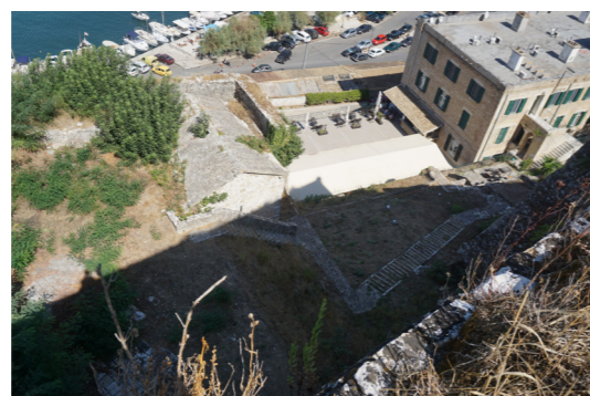
Άποψη επιπρομαχώνα από ψηλά.