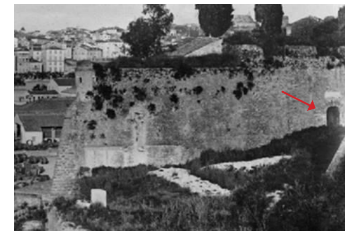
Δυτική πύλη, αρχές 20 ου αι.