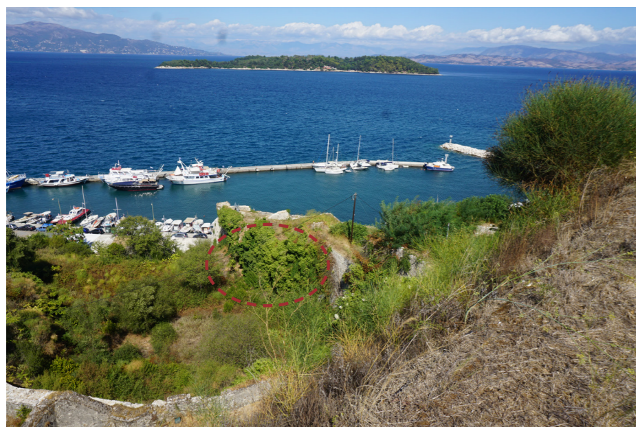
Σημειώνεται ενδεικτικά η θέση της πύλης, δεν είναι πλέον ορατή λόγω της πυκνής βλάστησης.