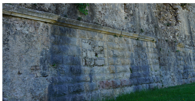
Άποψη του ανατολικού τμήματος του μετώπου. Διακρίνεται η δόμηση της εξωτερικής παρειάς από λαξευτούς λίθους με κυφωση.