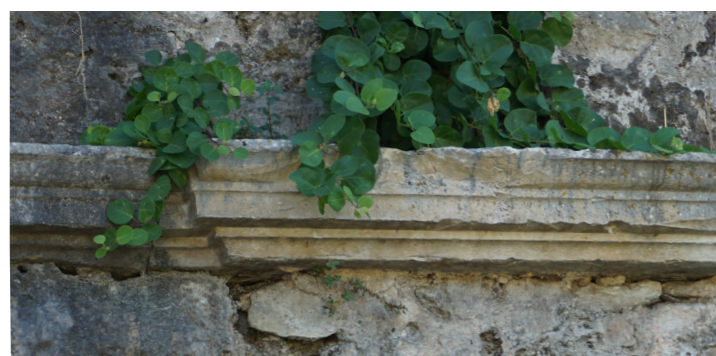
Το λίθινο γείσο (σε δεύτερη χρήση) στέψης της βάσης στο ανατολικό τμήμα του μετώπου.

Το μέτωπο των τειχών προς τη θάλασσα. Επισημούνται αρμοί στην τοιχοποιία λόγω οικοδόμησης σε διαφορετικές οικοδομικές φάσεις.