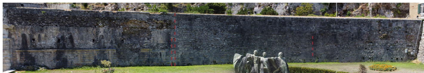
τμήμα με σκαρπωτή βάση και γείσο επίστεψης