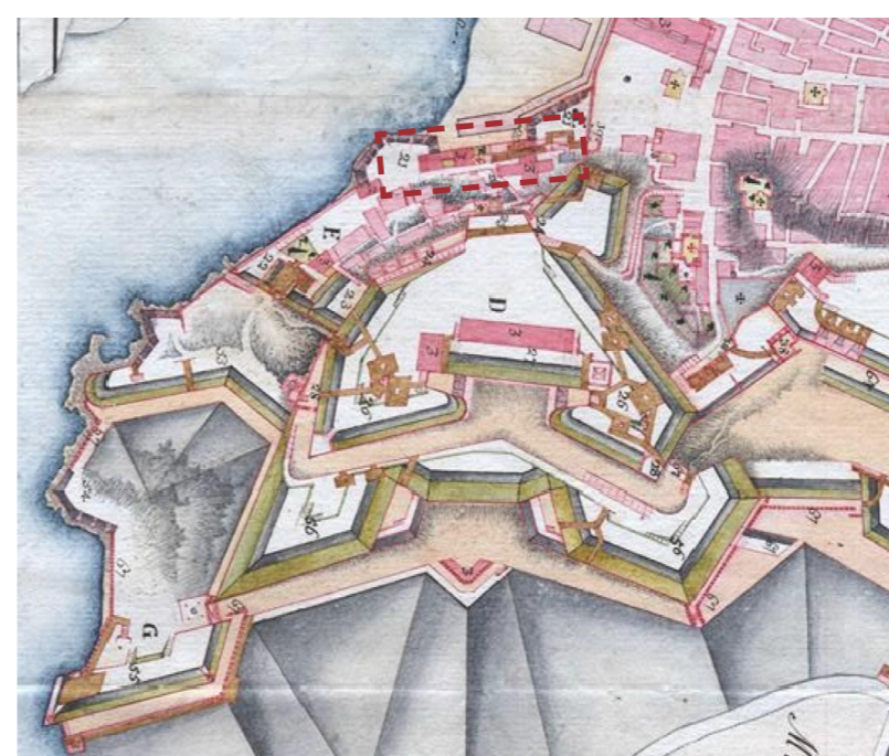
Νέο Φρούριο, λεπτομέρεια από τον χάρτη Ganassa, Museo Correr, τέλη 18ου αι.. Επισημίνεται το τμήμα του εξεταζόμενου μετώπου.