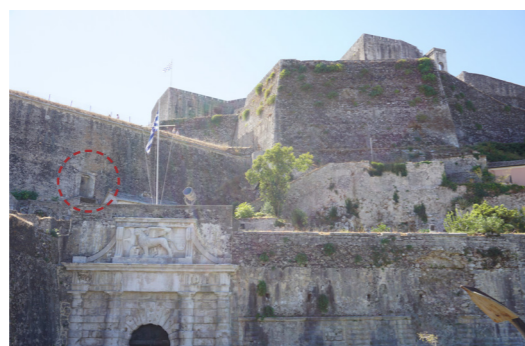
Είσοδος στοάς προς πυροβολείο ανατολ. όψης.