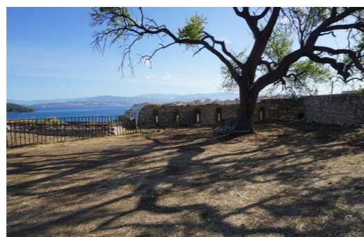
Τυφεκιοθυρίδες στο ανατολικό παραπέτο.