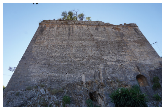
Προστασία νότιας πύλης από τον ημιπρομαχώνα.