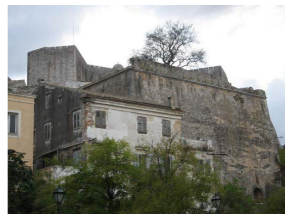
Άποψη από τα ΝΑ