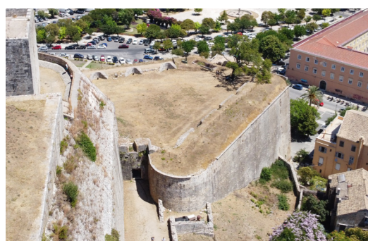
Ο ημιπρομαχώνας από ψηλά.