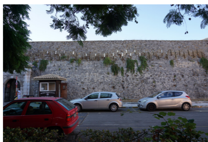
Τυφεκιοθυρίδες για την προστασία της νότιας πύλης.