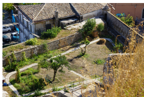
Χωμάτινο παραπέτο στη βόρεια όψη και τυφεκιοθυρίδες στην ανατολική.