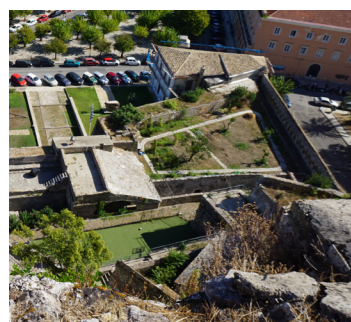
Άποψη από ψηλά.