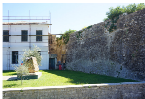
Βόρεια όψη, κτίριο σε επαφή με τον ημιπρομαχώνα.