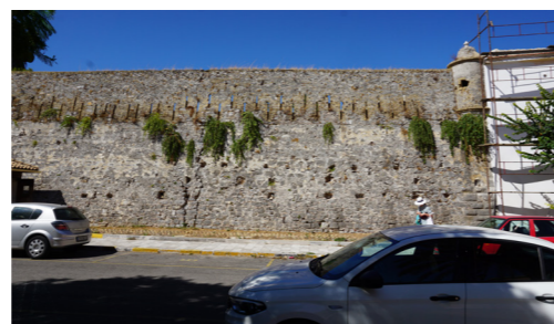
Νότια όψη, σκοπιά στην ανατολική γωνία.