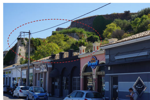
Άποψη του οχυρού από τα δυτικά, διακρίνεται η μέτωπο των καταστημάτων.