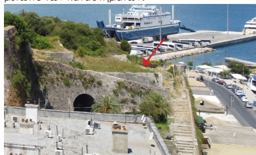
Τα τρία διαφορετικά επίπεδα και η σκάλα ανόδου.