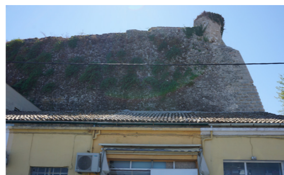
Βόρεια όψη, διακρίνεται η σκοπιά.