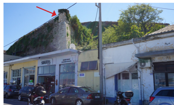
Η σχέση των καταστημάτων με το οχυρό.