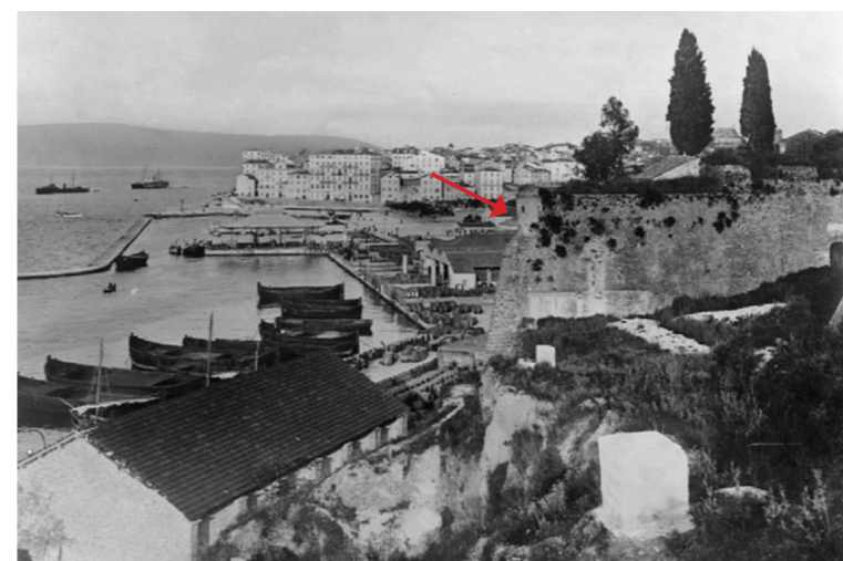
Το οχυρό Punta Perpetua στις αρχές του 20 ου αι.